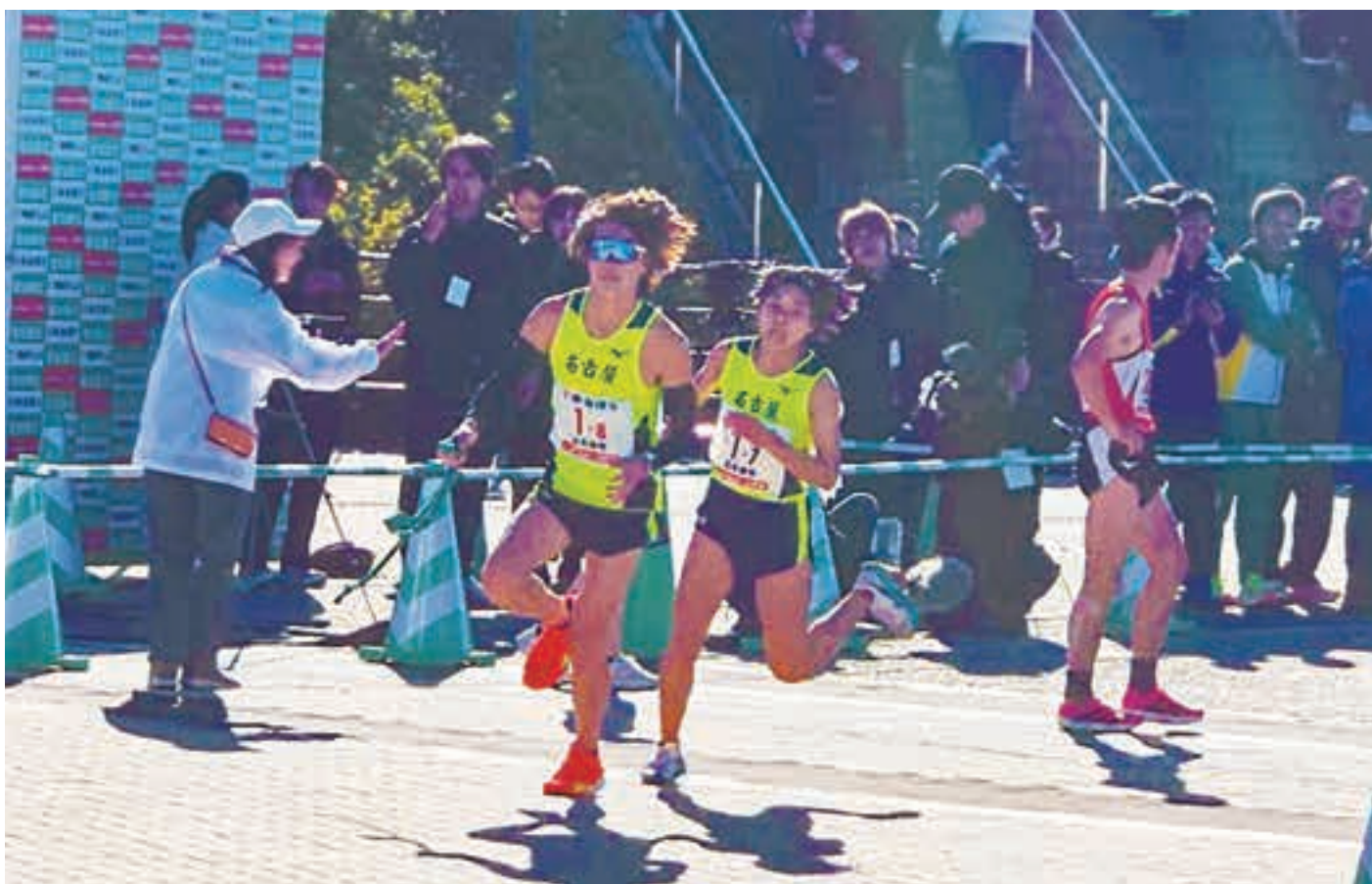
第18回愛知県市町村対抗駅伝競走大会