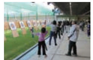
アーチェリー体験教室