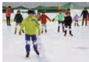
スケート体験教室