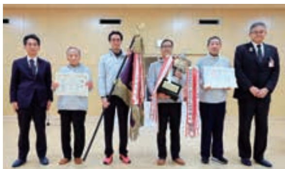
区対抗の部で優勝した名東区