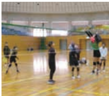
ソフトバレーボール

令和7年1月18日(土)、小学生による各大会、「ドッジボール」(稲永スポーツセンターにて)、「ソフトバレーボール」(千種スポーツセンターにて)、「バドミントン」(中村スポーツセンターにて)が開催され、熱戦を繰り上げました。