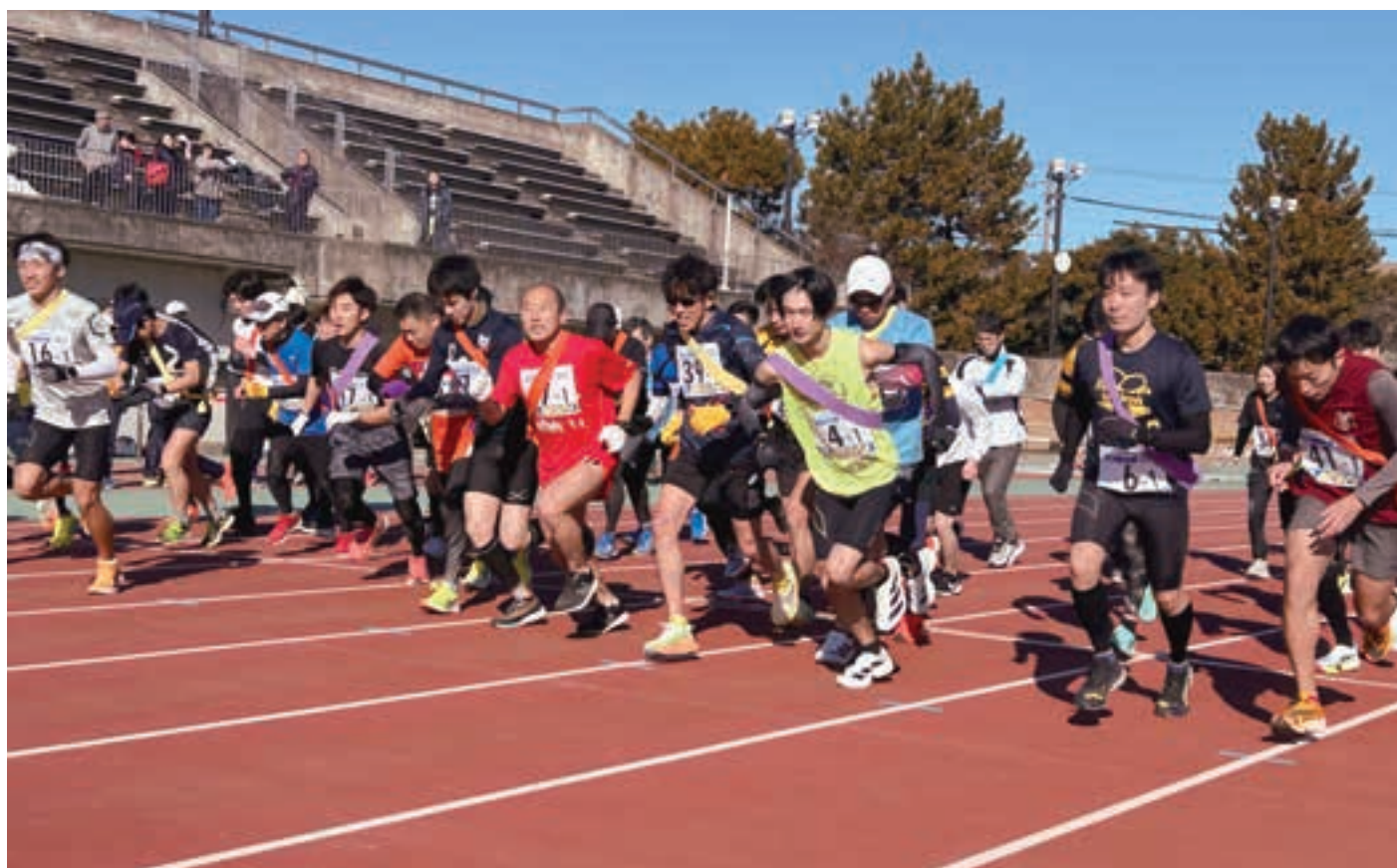
第39回 なごやカップ ミニ駅伝大会 2025