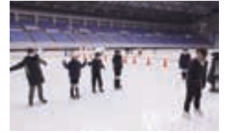
スケート体験教室