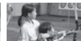
▲アーチェリー体験教室