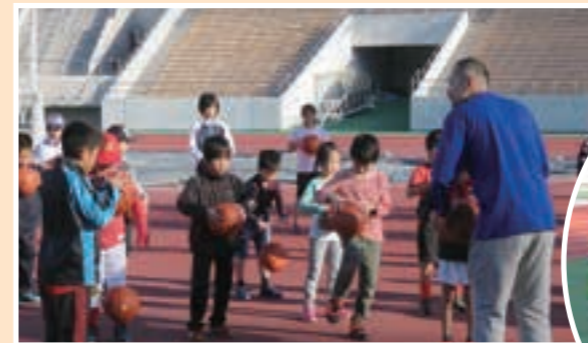
▲でらスポ☆スタジアム(バスケットボール)