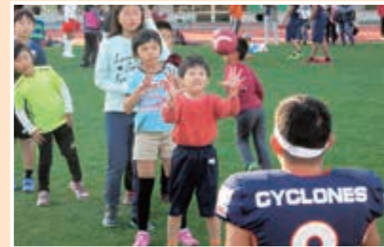
▲でらスポ☆スタジアム(アメリカンフットボール)