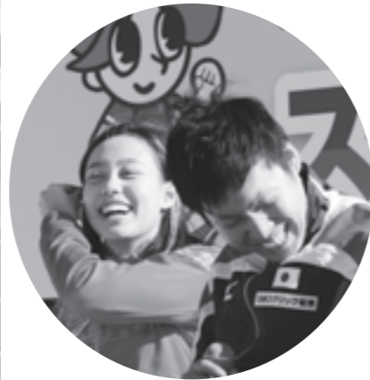
▲スピーチで盛りあがる2人