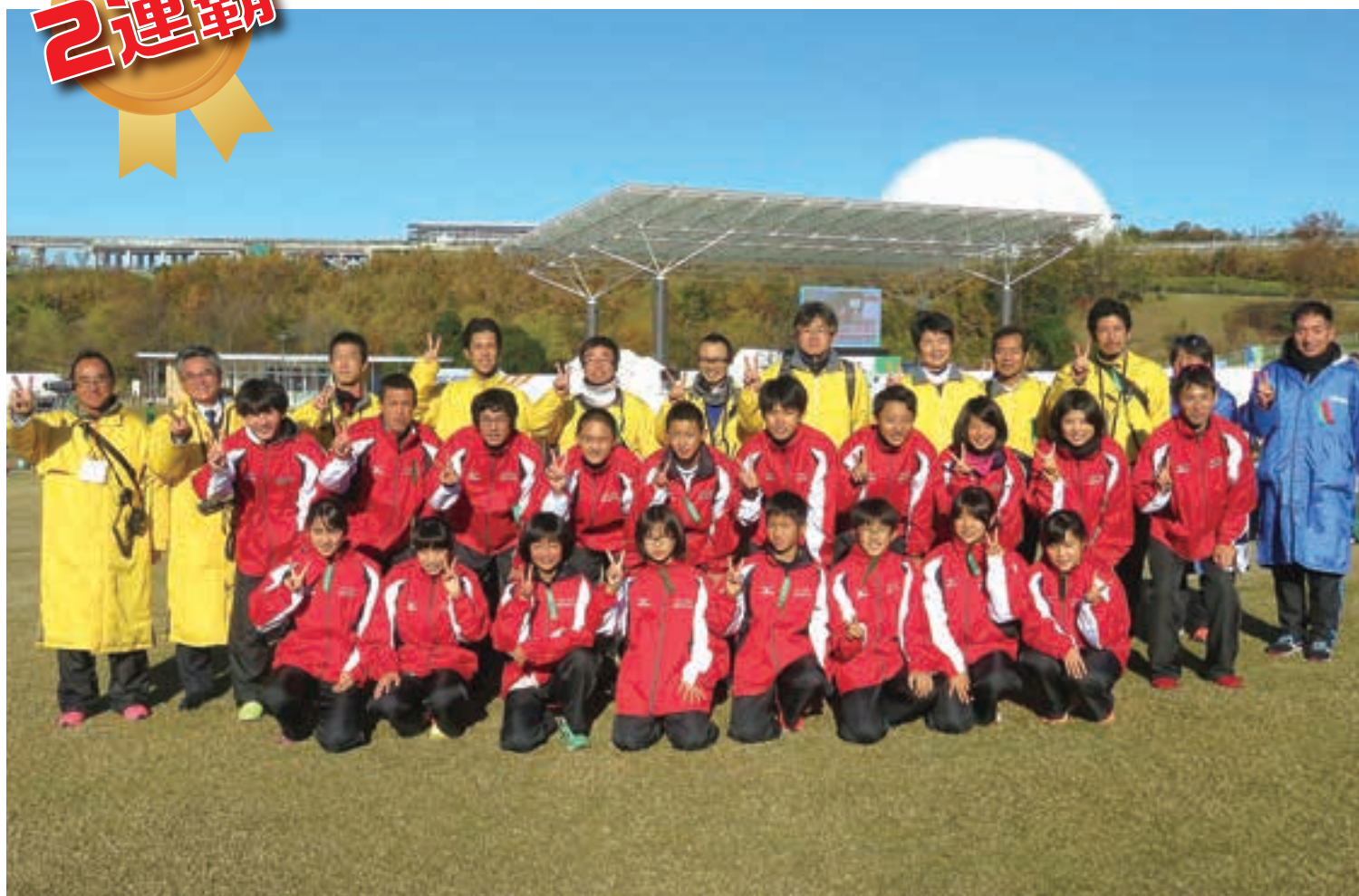
第11回愛知県市町村対抗駅伝競走大会 名古屋市チーム

公益財団法人 名古屋市教育スポーツ協会 (名古屋市体育協会) http://www.nagoya-taikyo.or.jp