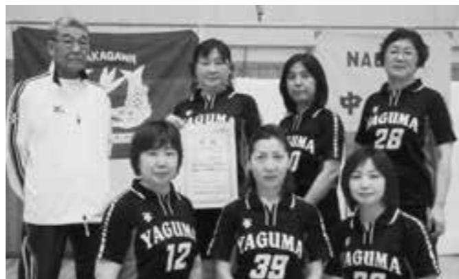
中川区区民スポーツ祭優勝のチームと共に

——これからもお元気で、地域のスポーツ普及にますますのご活躍を期待しています。本日はありがとうございました。