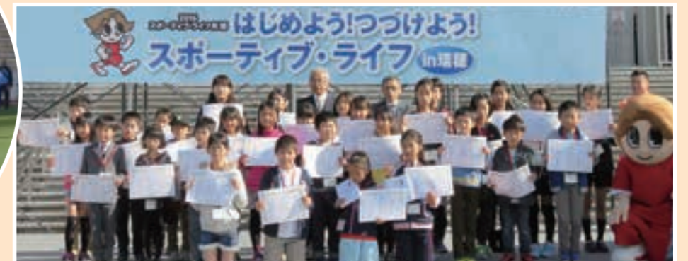
▲やろまい運動・スポーツ絵画コンテスト2016入賞者のみなさん