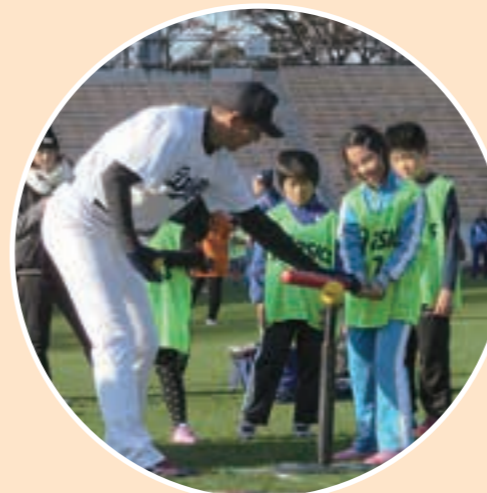
▲でらスポ☆スタジアム(野球)