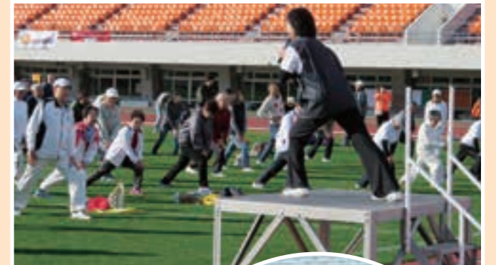
▲ラジオ体操&スロージョギング

「でらスポ☆スタジアム」などで約150人の参加者がスポーツを楽しみました。他にも、さまざまなグルメが楽しめるケータリングカーも集まり、スポーティブ・ライフ月間の締めくりにあふさわしい賑やかなイベントになりました。当協会も、このスポーツイベントを通じ、今後もスポーツの普及振興に努めてまいります。