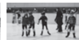
▲スケート体験教室(昨年度)