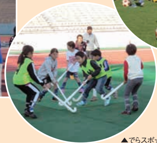
▲でらスポ☆スタジアム(サッカー)